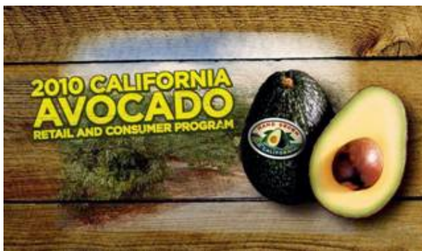
2010 Información para Minoristas

Las ventas de unidades de aguacates se han incrementado en todas las regiones de los Estados Unidos con un aumento del 17 por ciento en el nivel nacional. Para continuar el refuerzo a las ventas, la CAC está colaborando con tiendas minoristas en mercados objetivo cuyas iniciativas para el consumidor están en línea con la estrategia de la campaña del Productor de Aguacates de California.