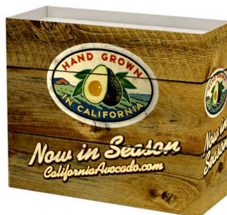
2010 Cajón Exhibidor

Este año, la demanda de cajones exhibidores de aguacates por parte de los minoristas ha sido impresionante, con más de 4.500 unidades enviadas a tiendas de todo el país. El total de materiales de punto de venta enviados a minoristas fue muy superior a 9.000.